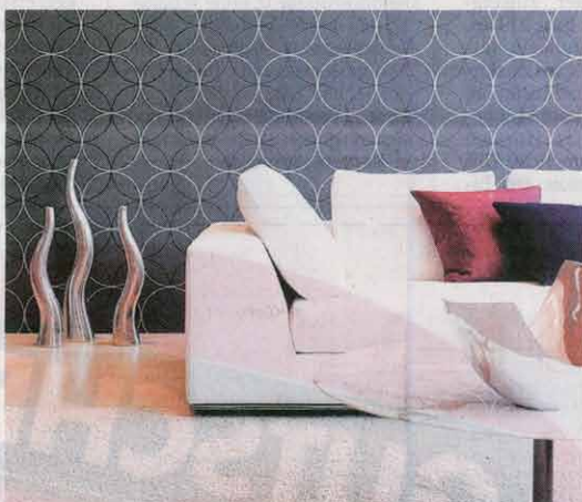
Der Name Thelen steht für kreative Vielfalt. Durch die eigene Möbelmanufaktur sind den individuellen Einrichtungswünschen keine Grenzen gesetzt.

und den insgesamt rund 140 Mitarbeitern einlädt. Im neuen Ausstellungszentrum haben Gäste, Besucher und Kunden die Möglichkeit, die gesamte Hauseinrichtung als Wohnkonzept zu durchlaufen, von der Dieleneinrichtung über Küche, Ess-, Wohn- und Schlafzimmer bis hin zu ju-